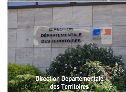
Direction Départementale des Territoires