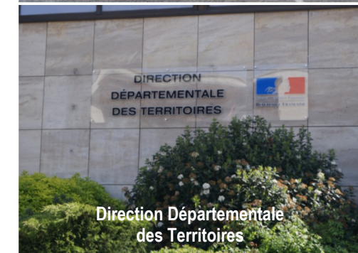
Direction Départementale des Territoires