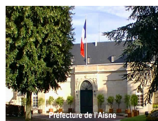
Préfecture de l'Aisne