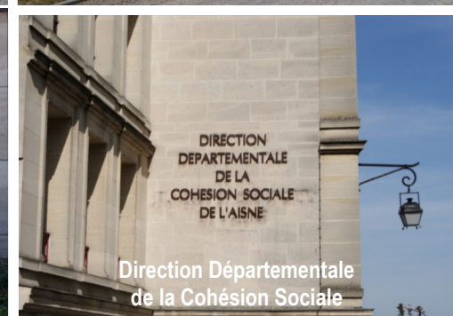
Direction Départementale de la Cohésion Sociale