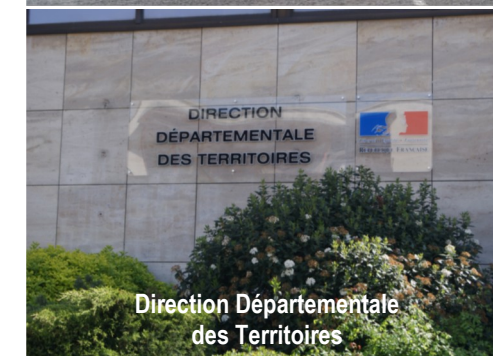
Direction Départementale des Territoires