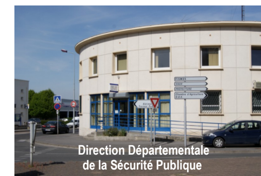
Direction Départementale de la Sécurité Publique

Préfecture de l'Aisne Pôle départemental de la communication interministérielle 2 rue Paul Doumer – CS 20656 – 02010 Laon Cedex ☎ 03.23.21.82.15 ✉ pref-communication@aisne.gouv.fr