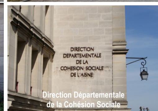
Direction Départementale de la Cohésion Sociale