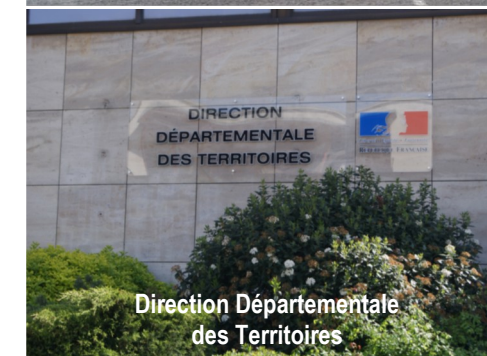
Direction Départementale des Territoires