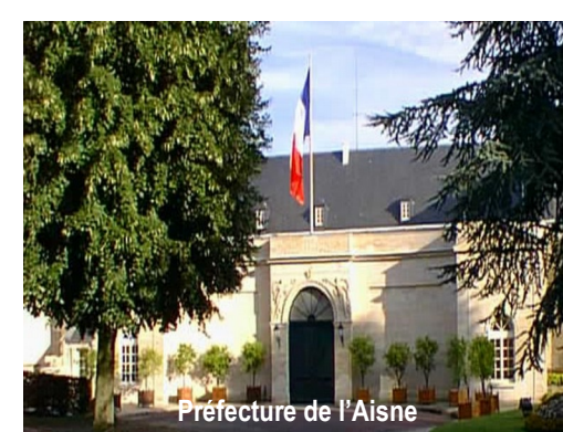
Préfecture de l'Aisne