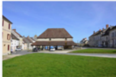
Les halles de Maigny-en-Creux sont positionnées sur une place verte offrant de courtes perspectives sur le village.