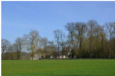
Le château de Maigny-en-Creux est entouré d'un parc arboré bordant les routes depuis l'extérieur du site.