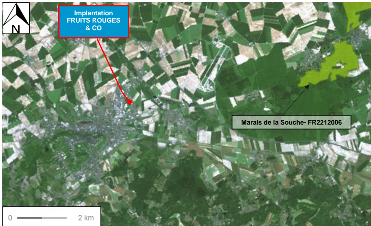
Cartographie des Zones Natura 2000 (Oiseaux) à proximité du Site

D'après les données de la DREAL, la zone Natura 2000 (directive oiseaux) la plus proche du site est située à environ 8 km à l'est du site. Il s'agit de FR2212006 – Marais de la Souche