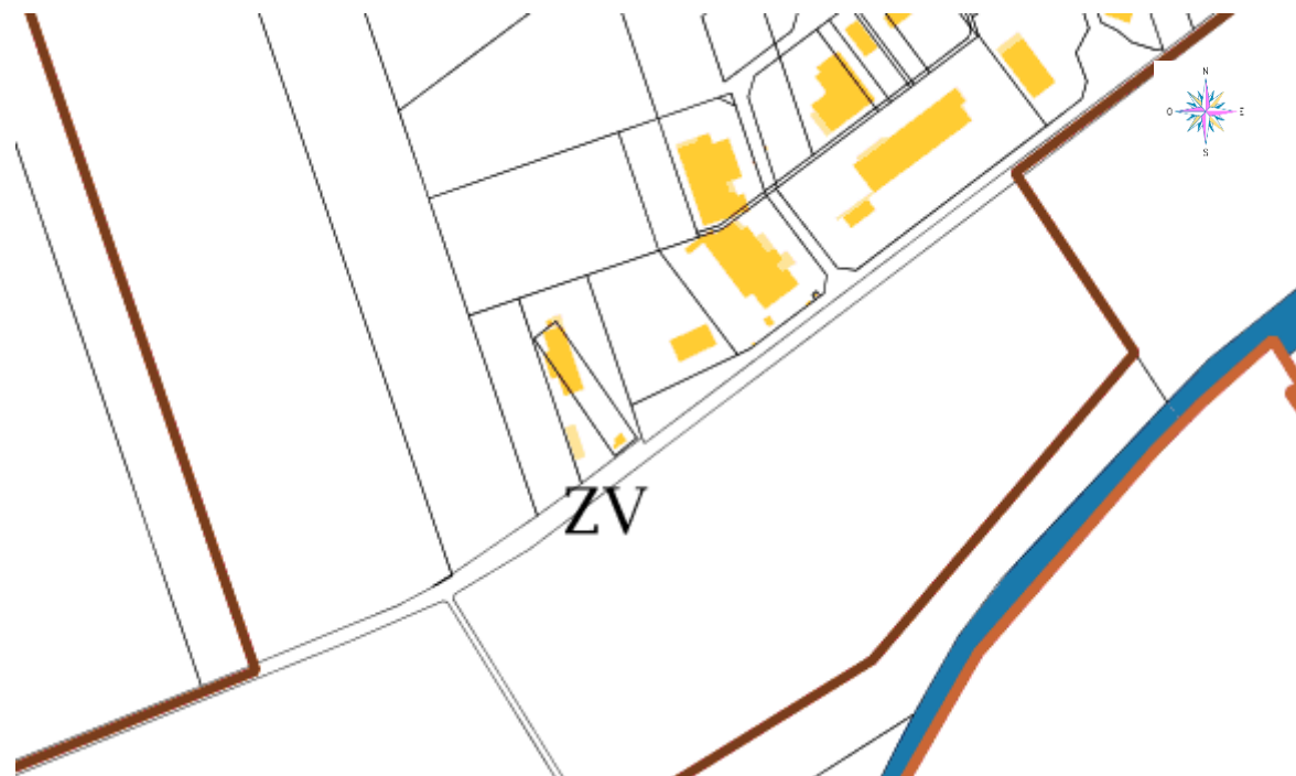
Section parcellaire de la zone d'étude