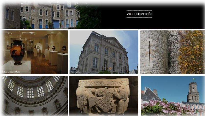
Visite culturelle des bâtiments du centre historique de Boulogne-sur-Mer

M. Serge LEGROUX Proviseur et référent de la cordée 03 21 09 20 18 ce.0620052v@ac-lille.fr