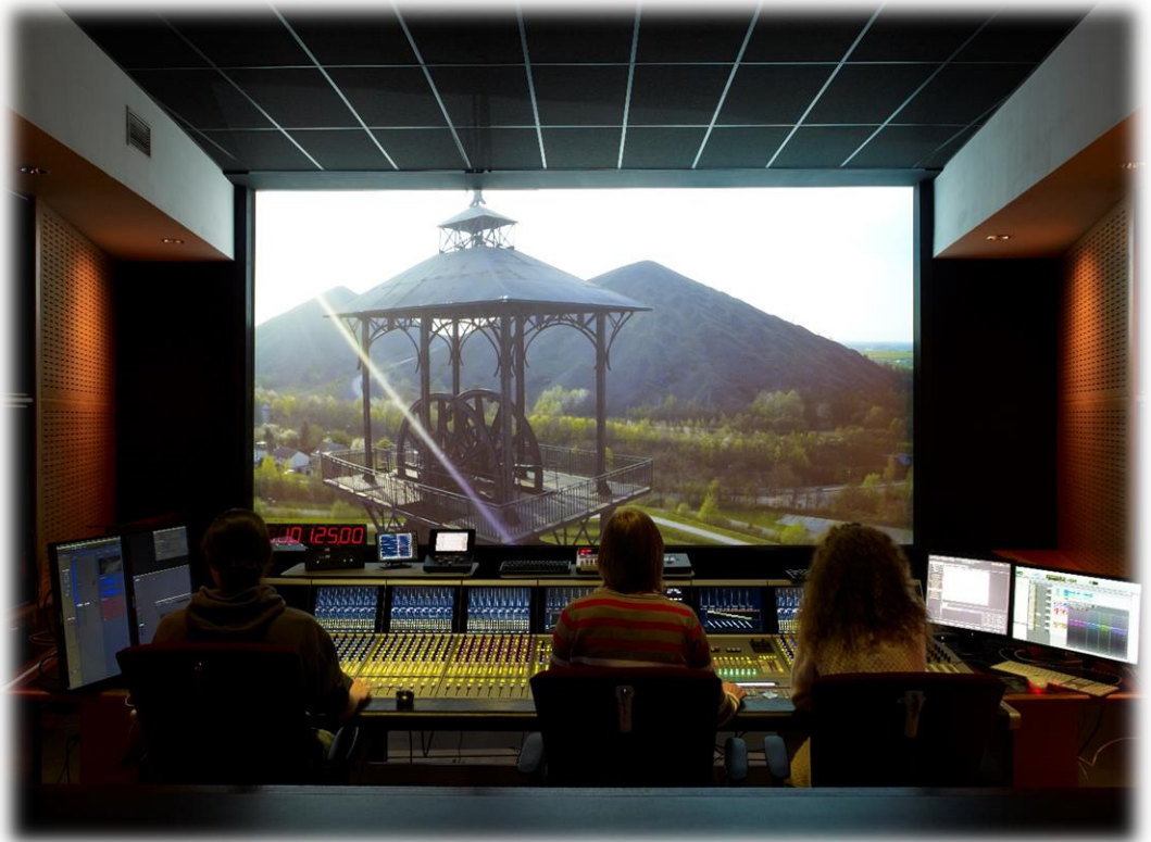
Le-Fresnoy, auditorium de mixage du pôle son

Parcours artistiques et métiers de la culture et de l'audiovisuel