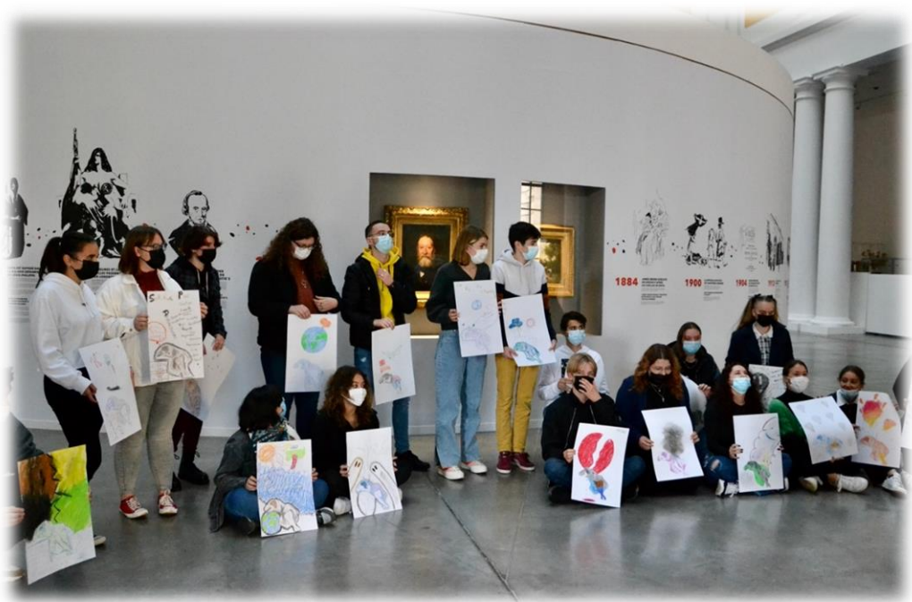
Atelier d'arts plastiques réalisé par les élèves du PEI Terminale au Palais des Beaux-Arts de Lille durant le stage intensif des 2 et 3 novembre 2021