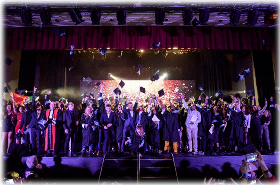
IUT de l'Oise Une formation, un avenir