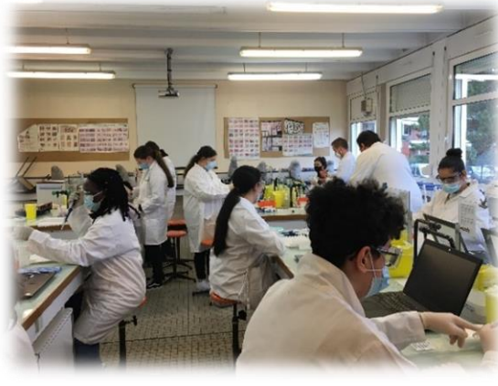
A la découverte des Biotechnologies