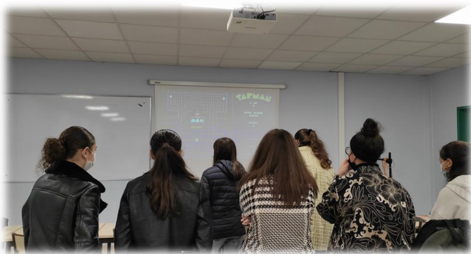
Visite des élèves du collège Lucie Aubrac de Tourcoing sur le site INSPE de Villeneuve d'Ascq le 22 octobre 2021