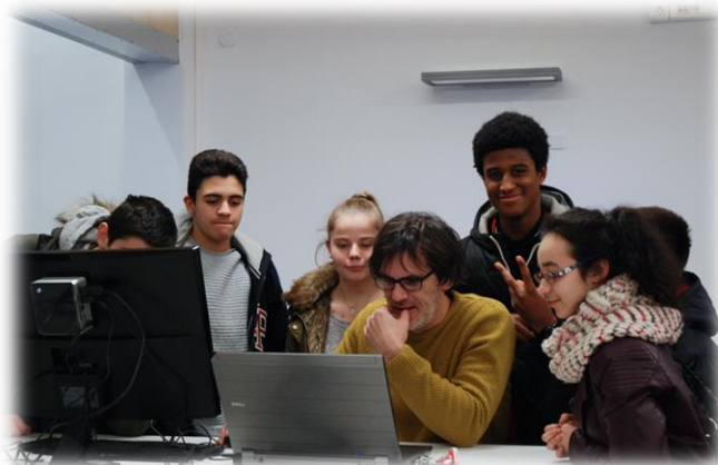
Atelier de création du Fablab avec un enseignant chercheur de Centrale Lille