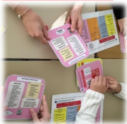
Jeu Time's Up Métiers : On joue et on découvre