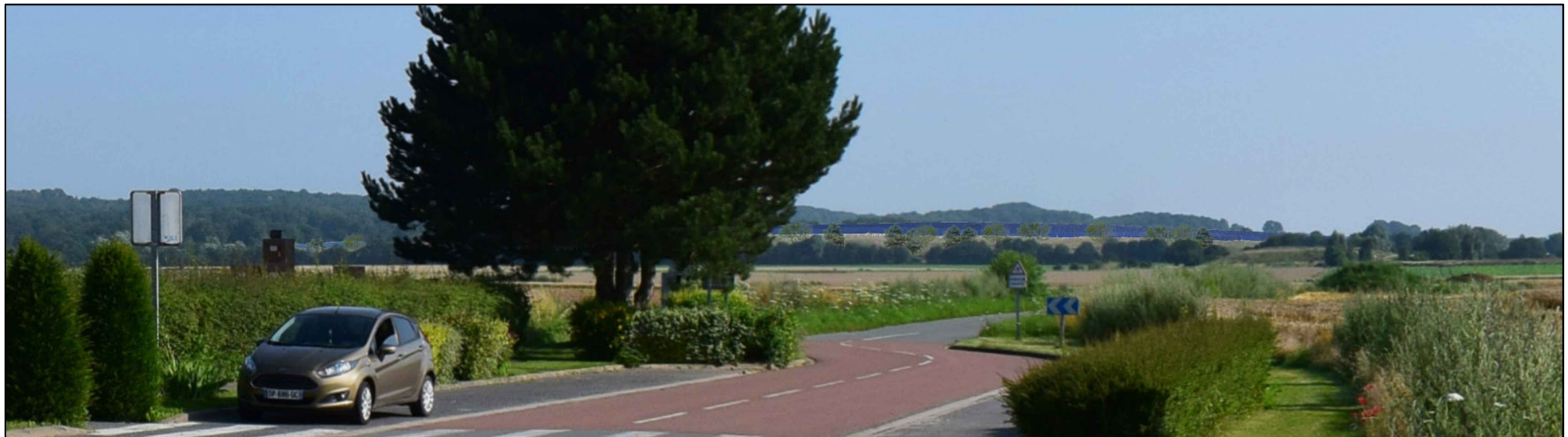
VUE PC06-2 depuis la commune de Savy, avec la nouvelle haie végétale

REPERAGE DES VUES : voir plan de situation PC1