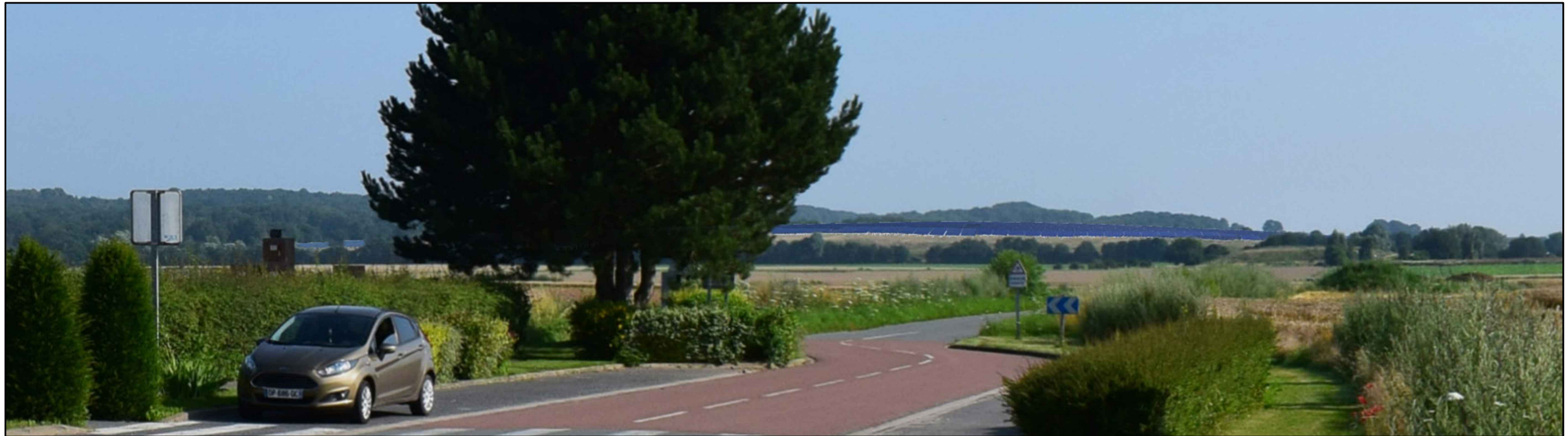
VUE PC06-2 depuis la commune de Savy