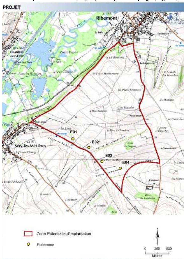
Carte de présentation du projet (Description du projet page 13)

2 Garde au sol : distance entre le sol et le bas de la pale