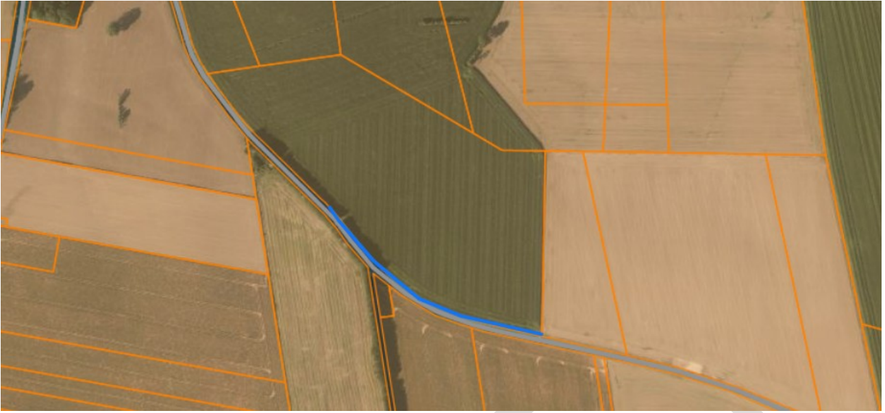
Emplacement de la seconde haie compensatoire sur la parcelle ZO 0039