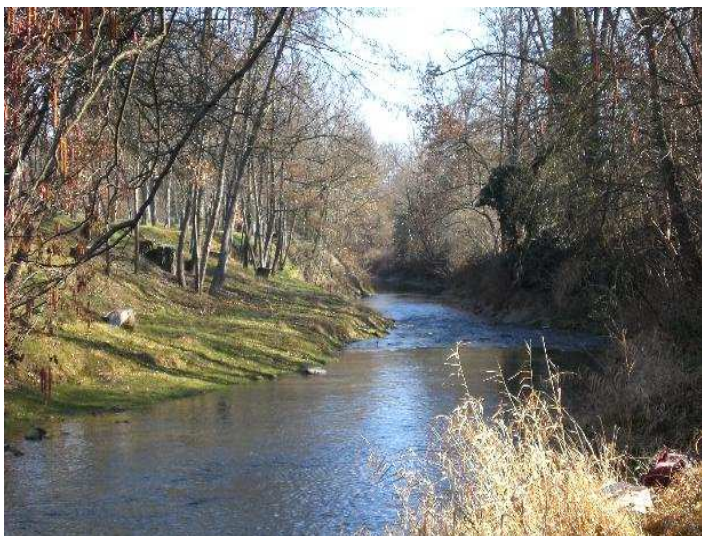
Illustration 3 : Ripisylve bien entretenue