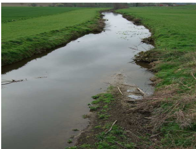
Illustration 1 : Coupe à blanc de la ripisylve