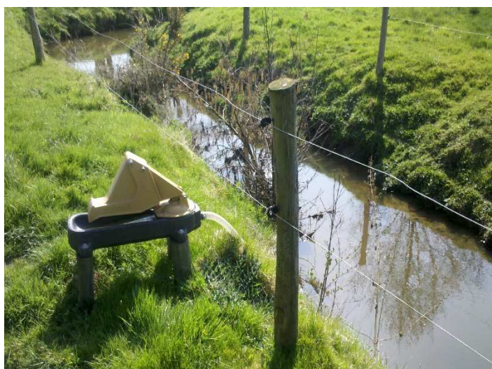
Illustration 4 : Abreuvoir aménagé / pompe à nez