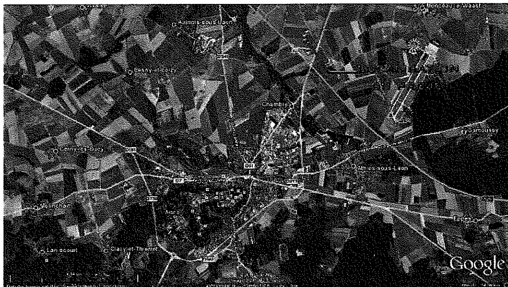
Figure 1 : Localisation du projet (source Google)

A l'heure actuelle, il n'y a pas d'activités aux alentours des parcelles dédiées au projet.