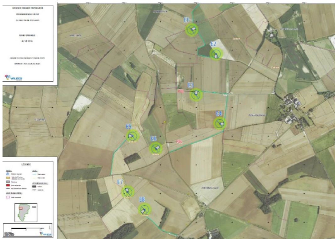
Carte de localisation du projet

Le parc s'implantera dans un secteur de cultures.