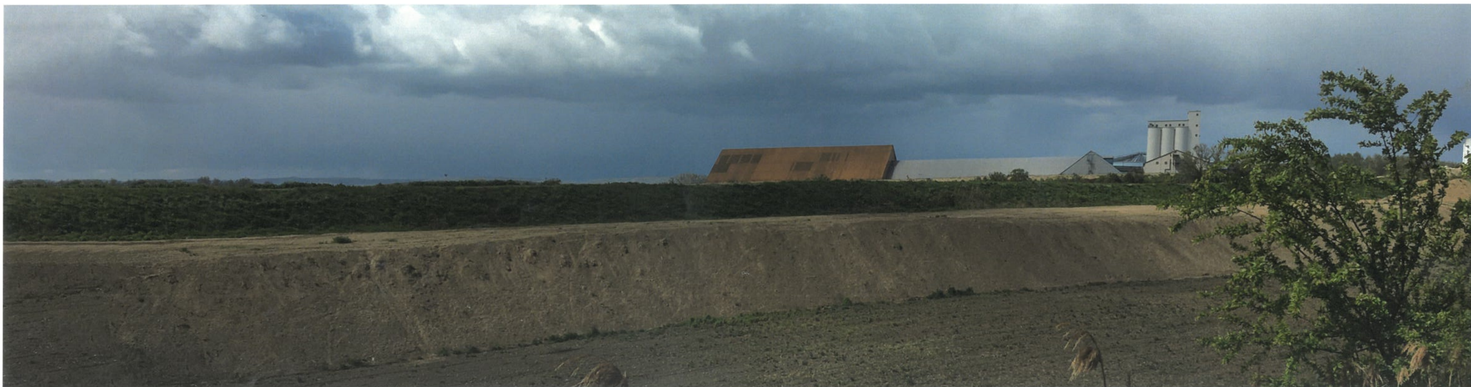
Point de vue n°3 - Vue depuis le merlon au nord du site