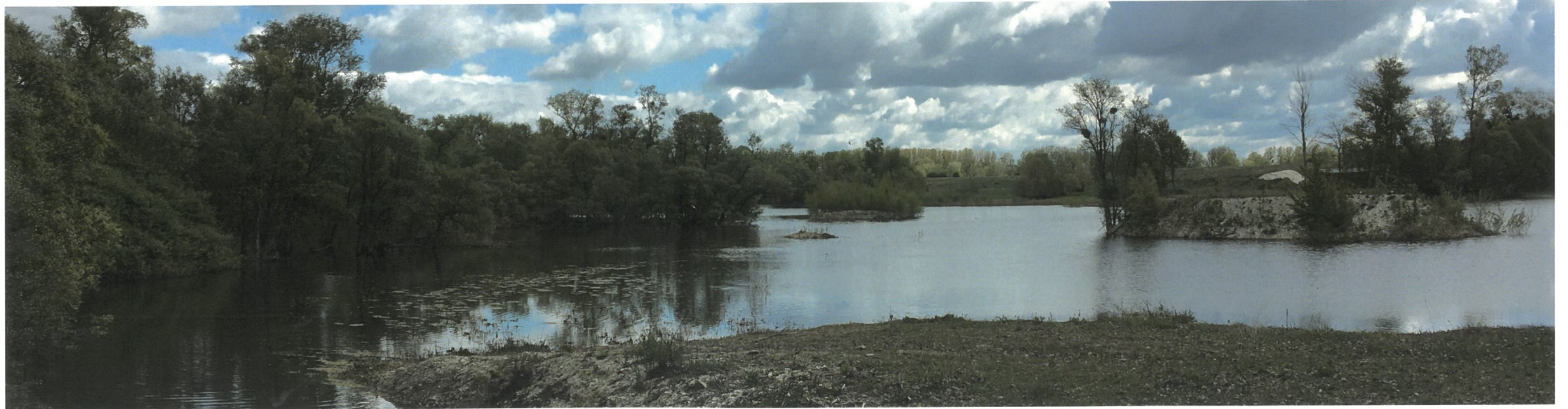
Point de vue n°5 - Vue depuis l'étang au sud-ouest du site