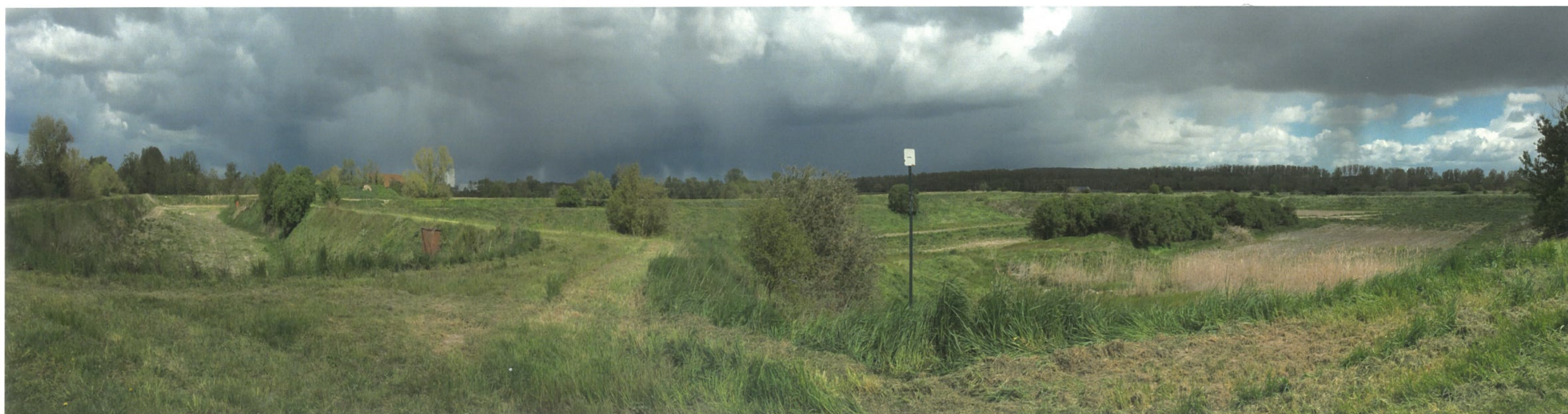
Point de vue n°1 - Vue depuis l'entrée du site au sud