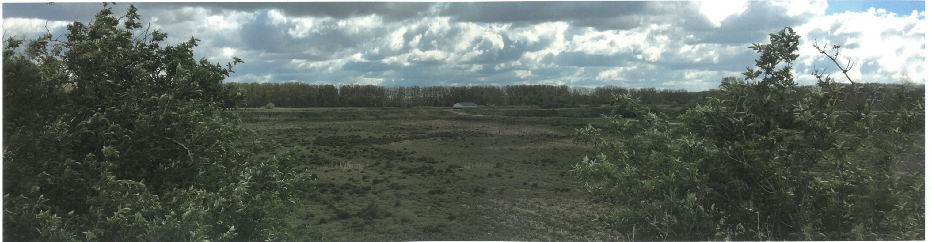
Point de vue n°4 - Vue depuis le merlon à l'ouest du site