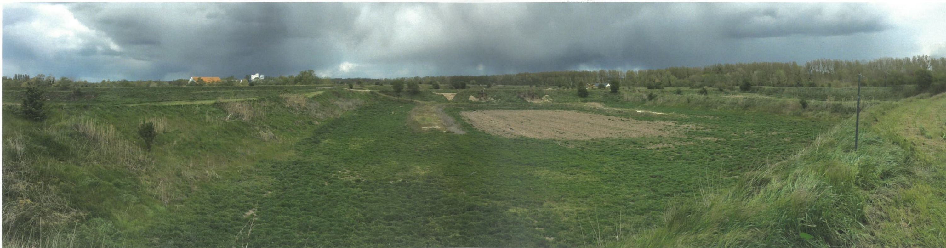
Point de vue n°2 - Vue depuis le merlon à l'est du site