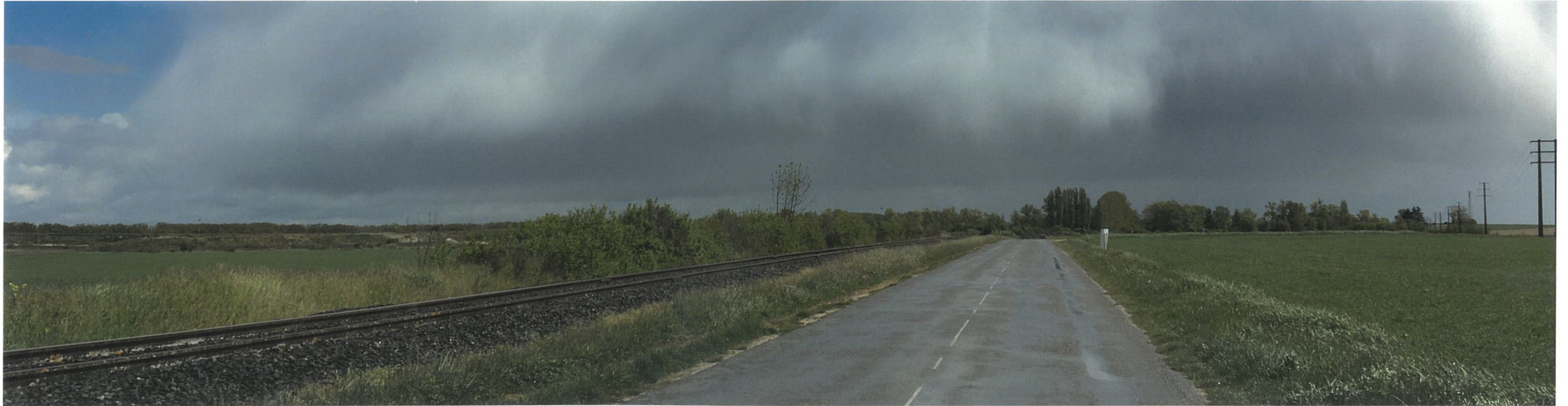
Point de vue n°8 - Vue depuis la Route Départementale n°623 au niveau de Condé-sur-Suipe