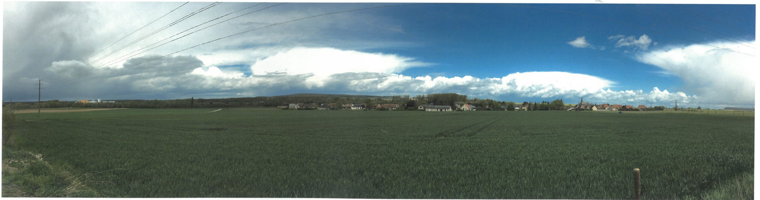
Point de vue n°6 - Vue depuis le château d'eau au sud du site