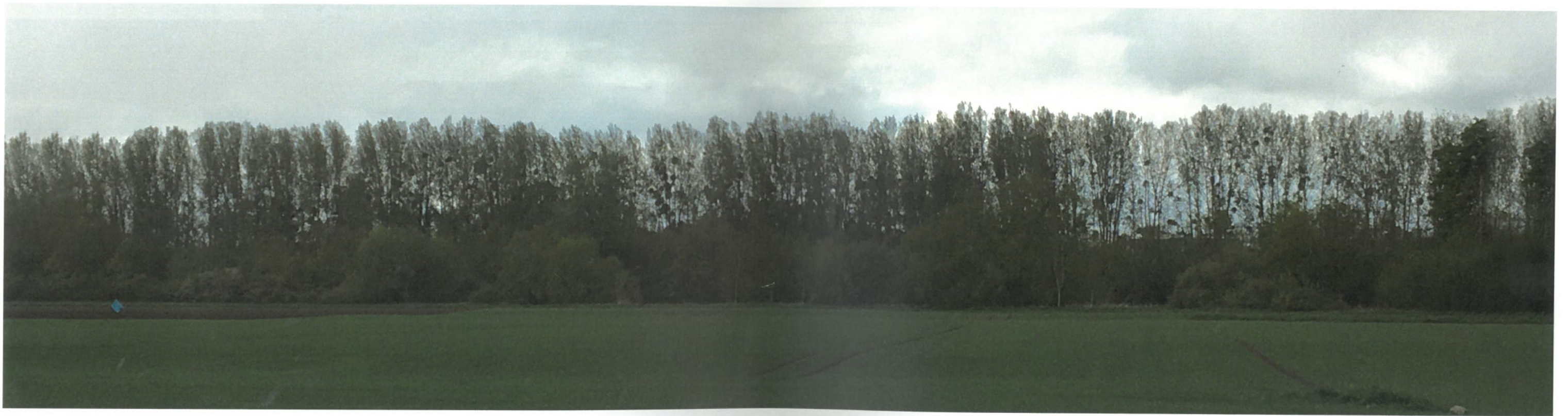
Point de vue n°7 - Vue depuis la Route Départementale n°925 au niveau de Guignicourt