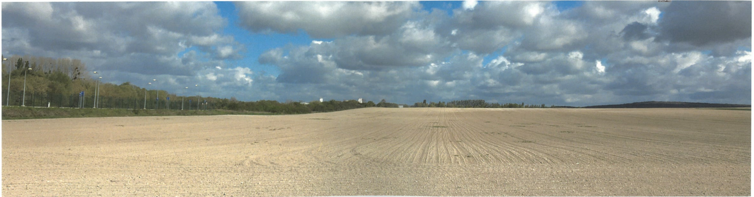
Point de vue n°9 - Vue depuis la Rue de Reims au niveau du passage à niveau